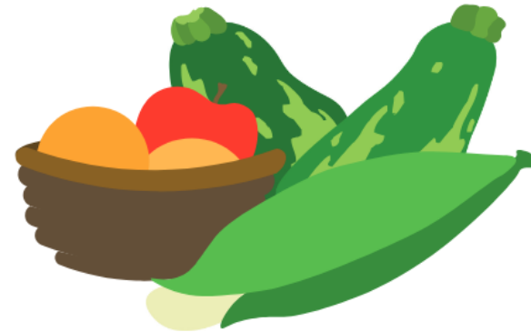
Figure 2: Under the Orange Dome page spread

Rowan had learned from his parents and in kindergarten that the world outside was still dealing with hot weather that made growing crops hard. But with new watering and technological techniques, crops grown outside the cities were still a large portion of the food they ate every day.