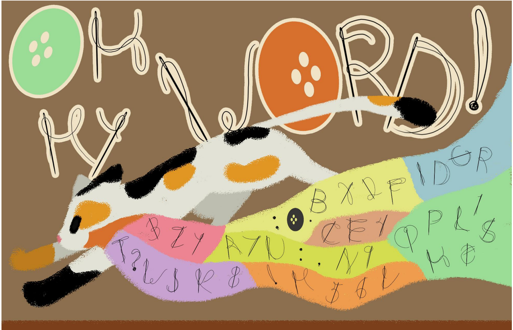
Figure 4: Patchwork Prep advertisement