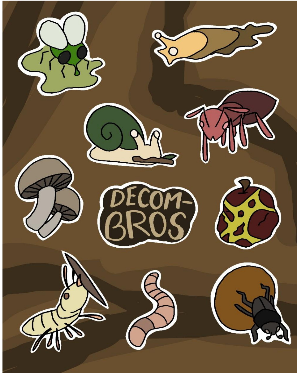
Figure 5: DecomBros stickers