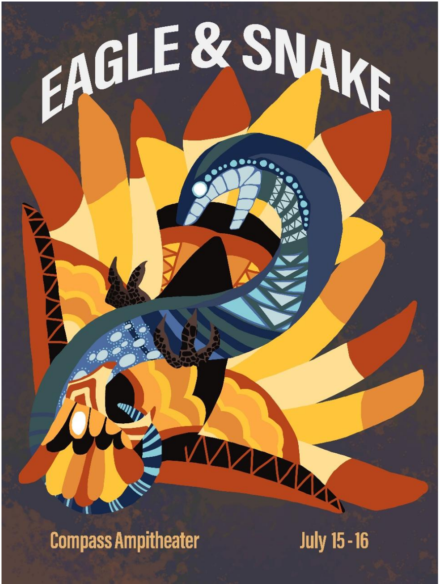
Figure 6: Eagle & Snake concert poster