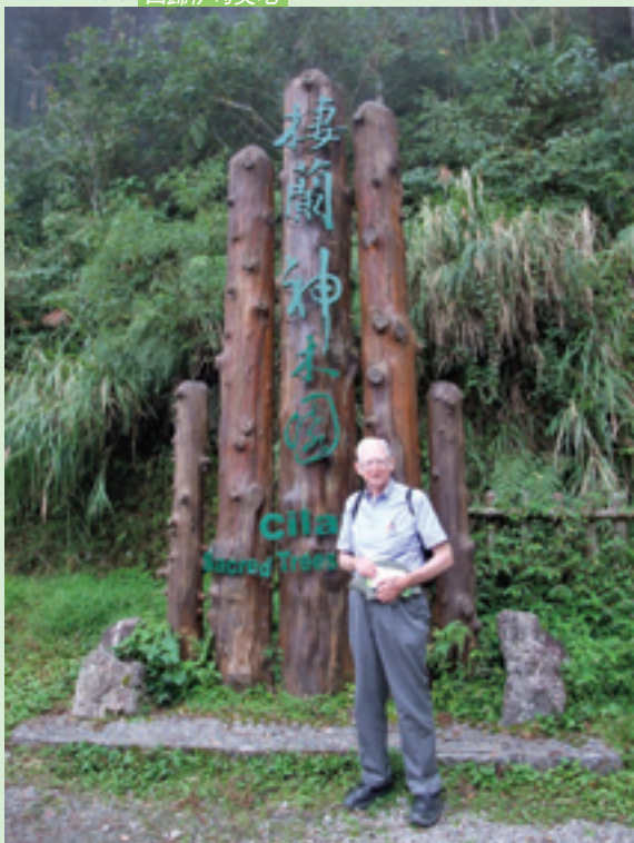
▲2008年羅斯頓攝於檜木園區。